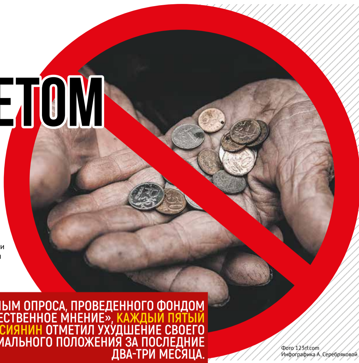
Инфографика А. Серебряковой

43,6 ТЫСЯЧИ РУБЛЕЙ – СТОЛЬКО СОСТАВЛЯЕТ РЕАЛЬНЫЙ ПРОЖИТОЧНЫЙ МИНИМУМ, РАССЧИТАННЫЙ ЭКСПЕРТАМИ ПАРТИИ СПРАВЕДЛИВАЯ РОССИЯ – ЗА ПРАВДУ НА ОСНОВЕ СТОИМОСТИ ПОТРЕБИТЕЛЬСКОЙ КОРЗИНЫ ПО ЦЕНАМ НА КОНЕЦ 2023 ГОДА.