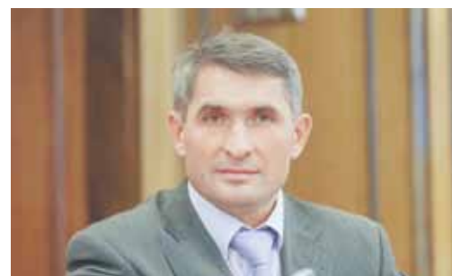
ГОСКОРПОРАЦИИ НЕЭФФЕКТИВНО ИСПОЛЗУЮТ НАРОДНЫЕ СРЕДСТВА, уверен Олег НИКОЛАЕВ, член комитета ГД по бюджету и налогам:

В сумме получается, что «Сколково» не развивает, а губит науку, ведь в стране есть два сорта инновационных организаций — прикормленные государством и им же брошенные. Говорят, что даже при самой уничтожающей критике проект не закроют, чтобы не портить репутацию премьеру Дмитрию Медведеву, который подписывал указ об открытии инновационного центра.